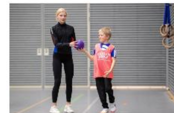
Kalajoella ongelmiin kehitetään ratkaisuja yhdessä eri toimijoiden kanssa