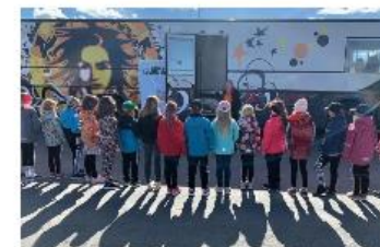
Kulttuuri- ja nuorisobussi kiertää kouluja Seinäjoella