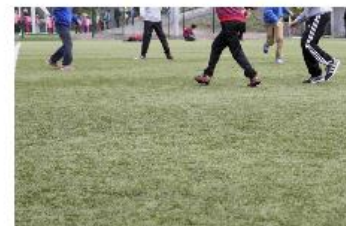
Johdon sitoutuminen, verkostotyö ja yhdessä sovitut tavoitteet ovat Kouvolan Harrastamisen mallin avaintekijöitä