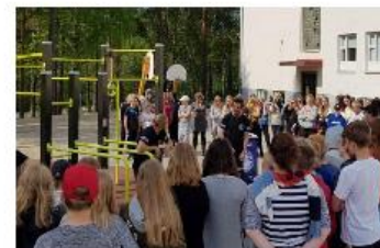
Etelä-Karjalan kouluilla tutustutaan harrastusviikolla Street Workoutiin